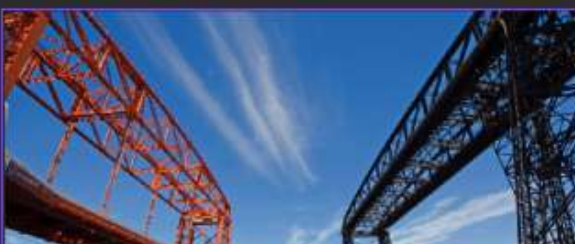
Fotografía tomada por Alejandro Goldemberg en 2014.